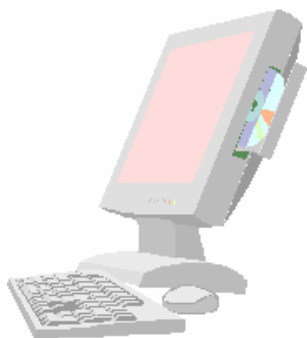
パーソナルコンピュータ